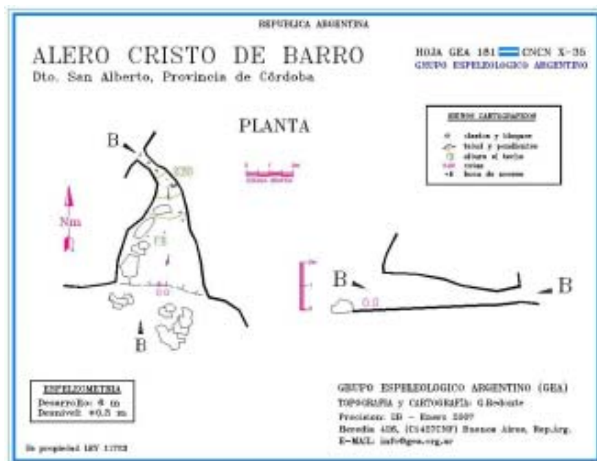
Cartografía digital del alero

Una topografía expeditiva, apuntar algunos datos y algunas fotos permitieron su posterior catastro.