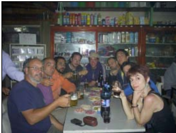
El GEA y el CMT en el Bar "El Cacique"