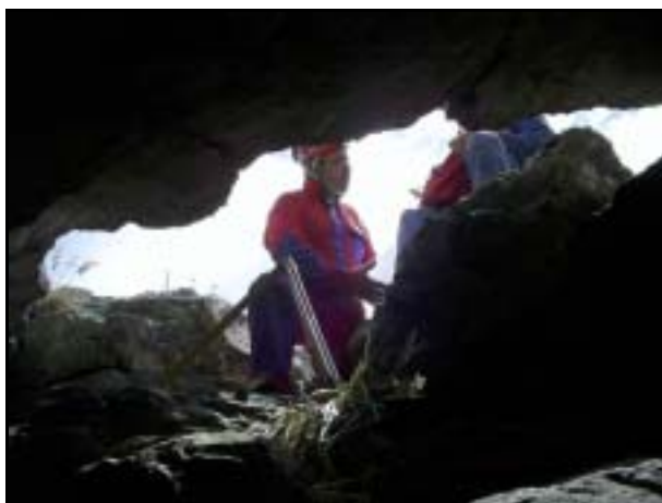
Topografía en cueva Esmeralda

Esta vez, el objetivo de campaña no contempló trabajar en el área Cuchilla de Las Águilas, donde GEA ha trabajado en 2005/6 sino que se orientó a realizar un reconocimiento en las cuevas Oscura y Gruta de Oro, correlacionar observaciones realizadas en las otras áreas y finalmente relevar la cueva Esmeralda, descubierta por Didier Lanthelme (GEA y FFS) en 2006.