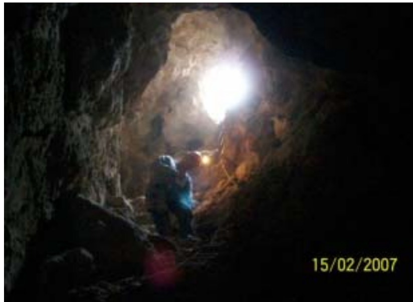
Caverna Aguada de Reyes

Queda como balance un saldo positivo, habiéndose alcanzado los objetivos fijados y que demandaron un gran esfuerzo dado el poco tiempo y las grandes distancias que diariamente debieron recorrerse. Esta expedición aunó la voluntad de miembros de GEA e INAE en pos de un objetivo compartido: estudiar y conservar las cavidades naturales.