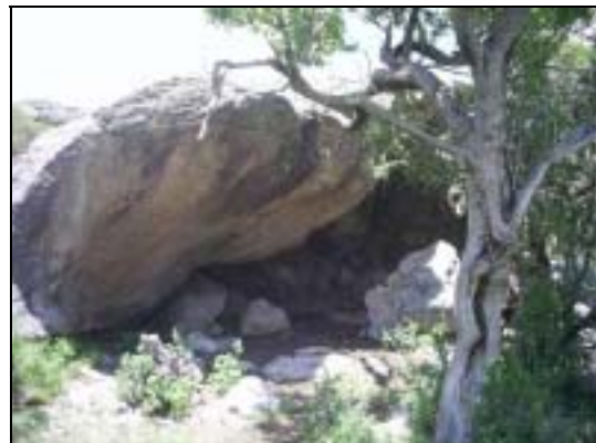
Interior y boca del alero