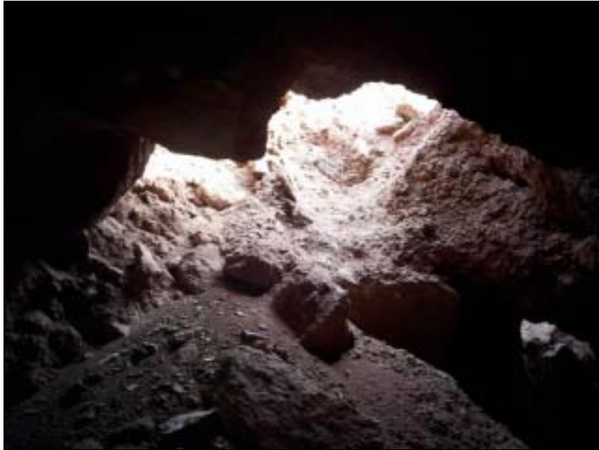
Cueva EPS VIII descubierta febrero 2007-08-13

Cabe señalar que estas son al presente las únicas cuevas desarrolladas en arcillas catastradas en el país. El GEA colaboró en la preparación de cartografía para un informe elaborado y presentado por la FAdE a la empresa destinado a sumarse al estudio ambiental del sitio y que será presentado en el próximo Congreso Argentino de Espeleología.