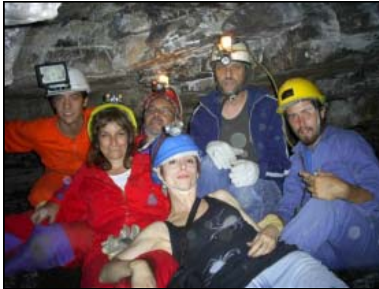
Miembros de GEA en la cueva Oscura