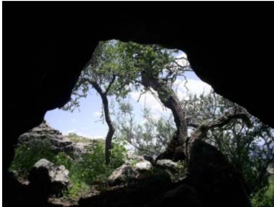
Boca principal