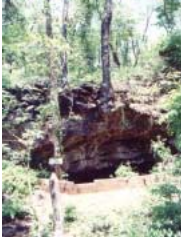
Boca de ingreso a la gruta