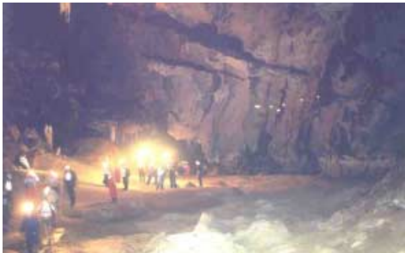
Salón Nro 6 de la Gruta do Tamboril – Minas Gerais